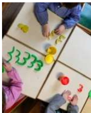
Le « 3 » en pâte à modeler

Ils sont très sérieux pour écrire les premiers chiffres avec les chiffres rugueux, puis avec de la pâte à modeler et enfin dans le sable, avant de l'écrire «pour de vrai» avec un feutre sur une feuille.