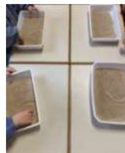
Le « C » dans le sable